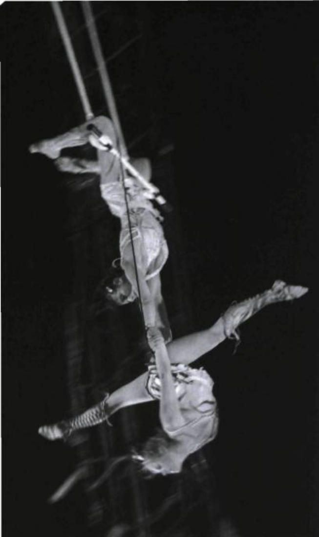
Ola Kala , spectacle des Arts Sauts, présenté à la Tohu à l'été 2006.