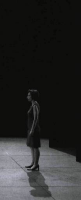
D'une seule main , écrit et mis en scène par Joël Pommerat (Compagnie Louis Brouillard), présenté au Centre Dramatique de Thionville en 2005.