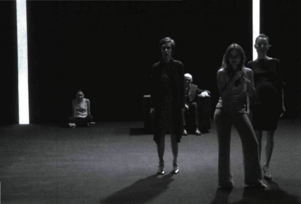
Au monde , écrit et mis en scène par Joël Pommerat (Compagnie Louis Brouillard), présenté au Théâtre National de Strasbourg en 2004.