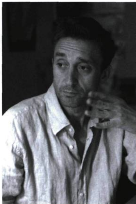
Joël Pommerat.