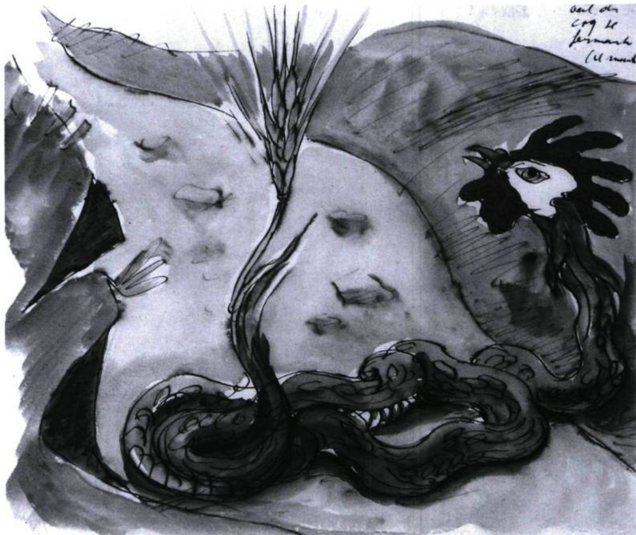
André Masson, Il meurt – Œil de coq se fermant, 1935. Encre et aquarelle sur papier.