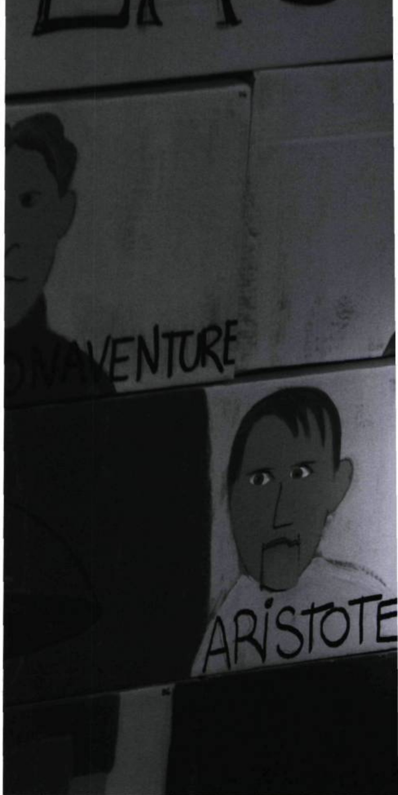
Loup Bleu dans Discours de la méthode, d'après Descartes (Théâtre du Sous-marin jaune, 2005). © Jean-François Landry.