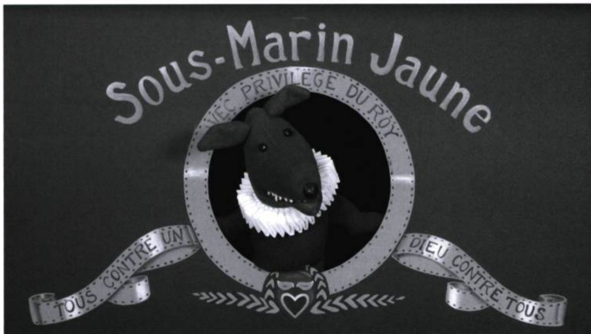
Loup Bleu dans les Essais, d'après Montaigne (Théâtre du Sous-marin jaune, 2008).