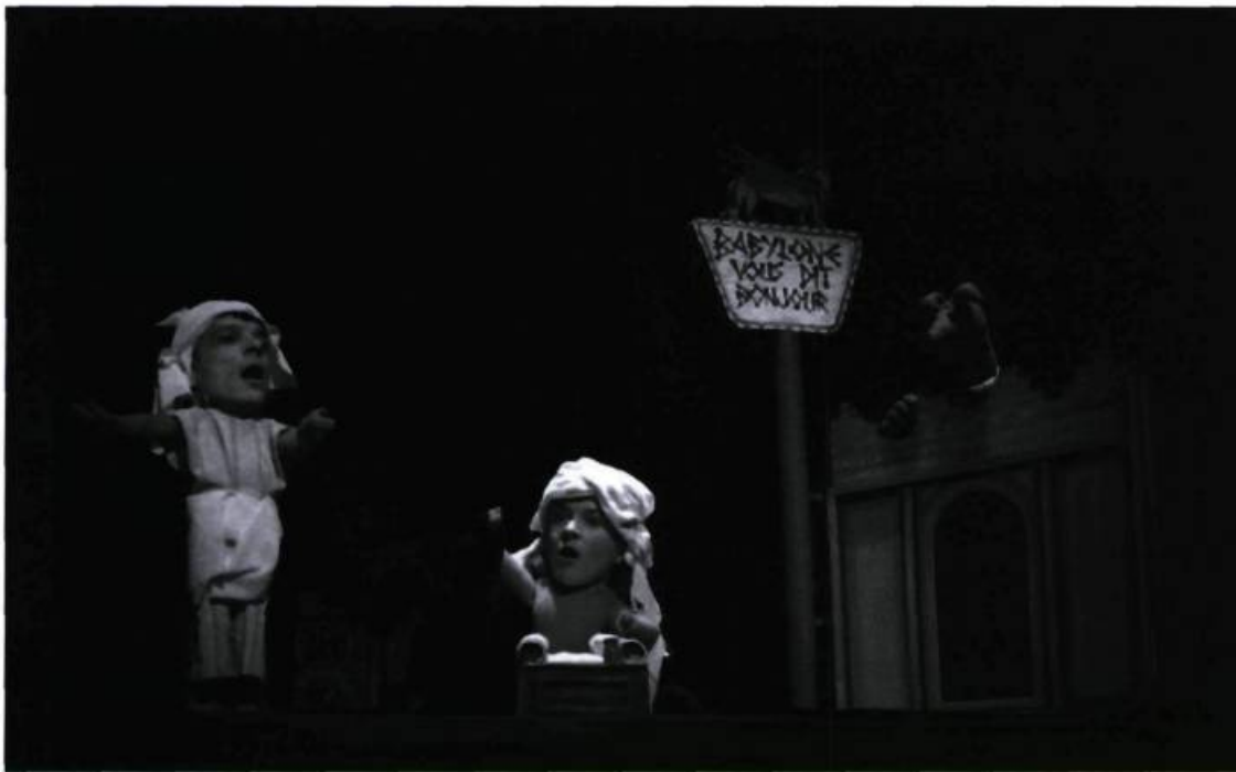
La Bible, d'après Dieu (Théâtre du Sous-marin jaune, 2000).

S'il est vrai que dans Candide, d'après Voltaire , notre coup d'envoi, je demeurais extérieur à l'action, agissant en tant que bonimenteur, les animaux n'en étaient pas moins représentés par quelques moutons, chiens et papillons. Dès La Bible, d'après Dieu , des animaux apparaissent dans chaque scène, pour rappeler à quel point, d'Abel à Moïse en passant par Noé, les personnages bibliques ont trouvé courage, viande et lait au sein du règne animal. Une des images fortes du spectacle (mais qui n'a pas été conservée) était le dialogue entre le Bouc émissaire et le Veau d'or, le premier abandonné dans le désert pour y transporter tous les péchés des Hébreux, le second confisqué par Moïse redescendu furax du mont Sinai.