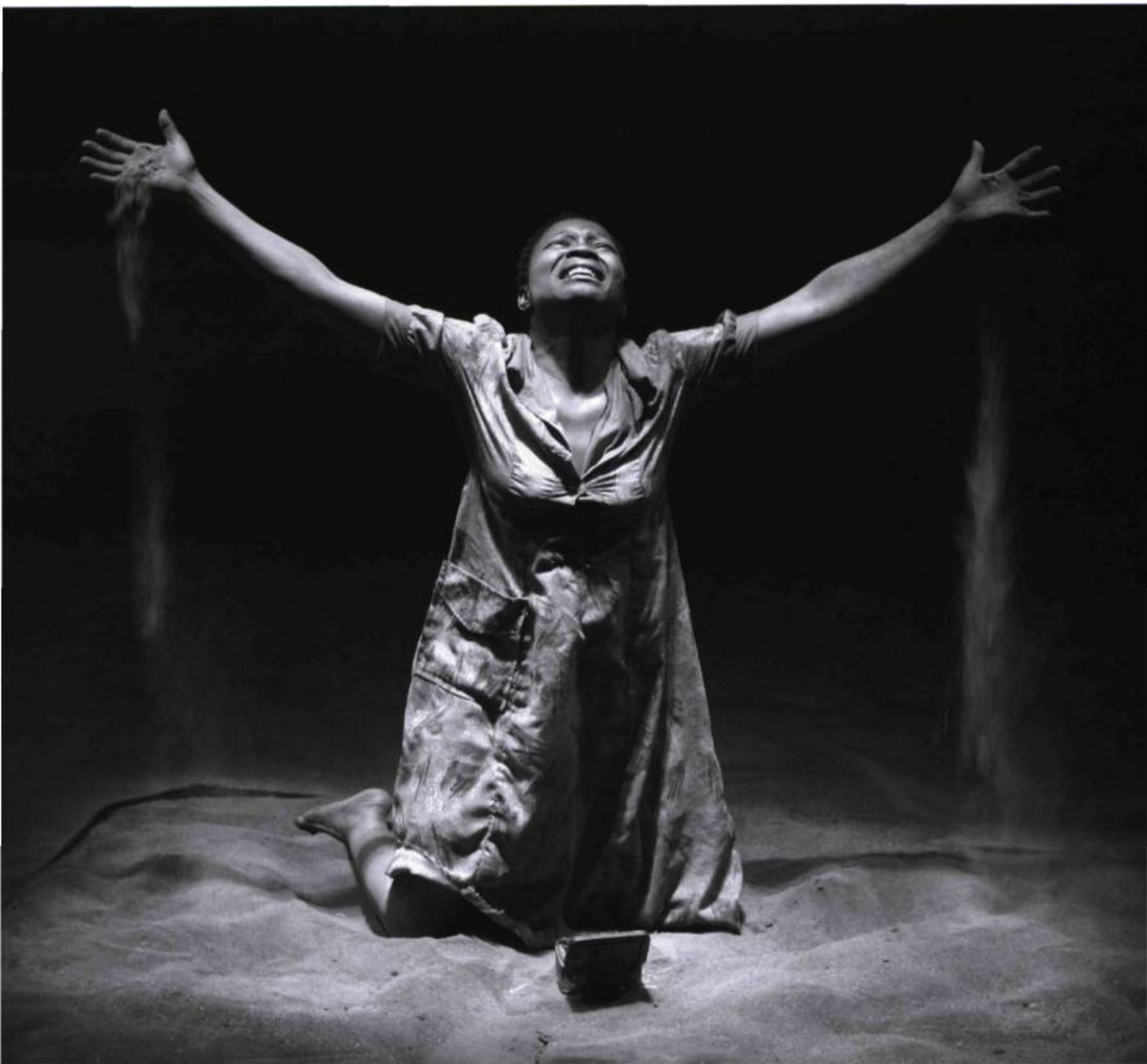
Molona , d'après l'Orestie d'Eschyle, adaptée et mise en scène par Yael Farber. Spectacle de The Farber Foundry, présenté à la Cinquième Salle à l'hiver 2009. © Market Theatre.