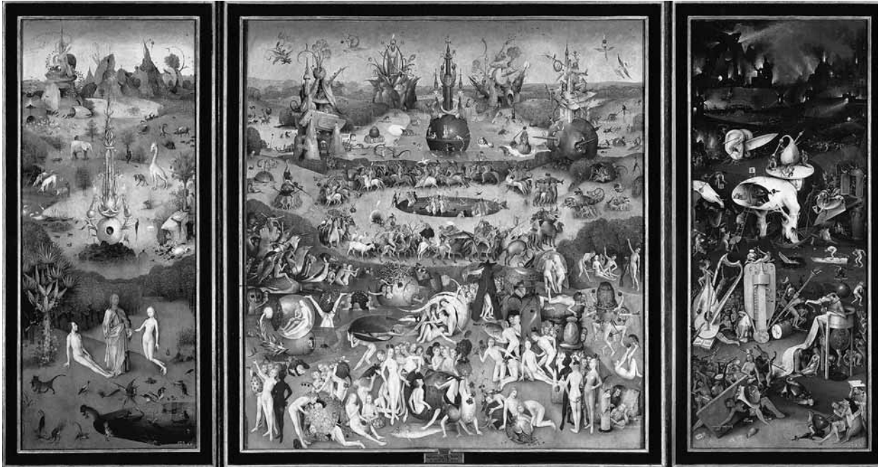
Jérôme Bosch, le Jardin des délices , v. 1500-1505. Musée du Prado, Madrid.