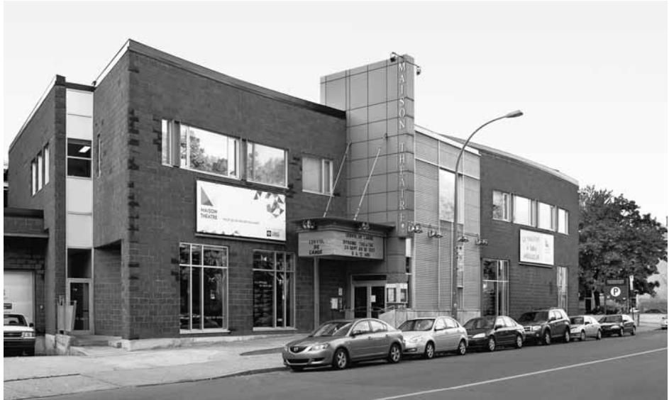
La Maison Théâtre. © Groupe Arcop.

pense qu'il faut encourager l'excellence, la qualité exceptionnelle. Pour moi, que quelqu'un rampe en me disant : « Le jeune public, c'est merveilleux ! », si ce n'est pas un créateur d'exception, ça ne me touche pas du tout ! Et là-dessus, il faut être prudent parce qu'on en a vu passer des choses, qu'on défendait parce que le jeune public avait la cote, alors que sur le plan artistique, ce n'était pas exceptionnel. Cela dit, il y a bien sûr une vivacité et une qualité remarquables au Québec, en théâtre jeunesse, mais il ne faut pas dire que tout est si bon que ça. »