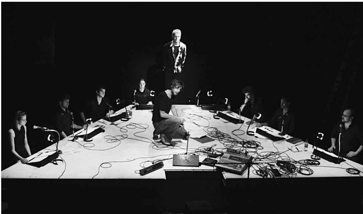
Caligula (remix) de Marc Beaupré (Terre des Hommes, 2010).

l'attention et l'imagination du spectateur et l'amène à se concentrer sur le son et le texte proféré de manière éminemment musicale.