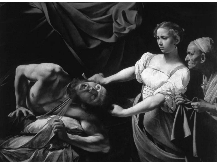
Le Caravage, Judith et Holoferne , 1598. Galerie nationale d'art ancien, Rome.