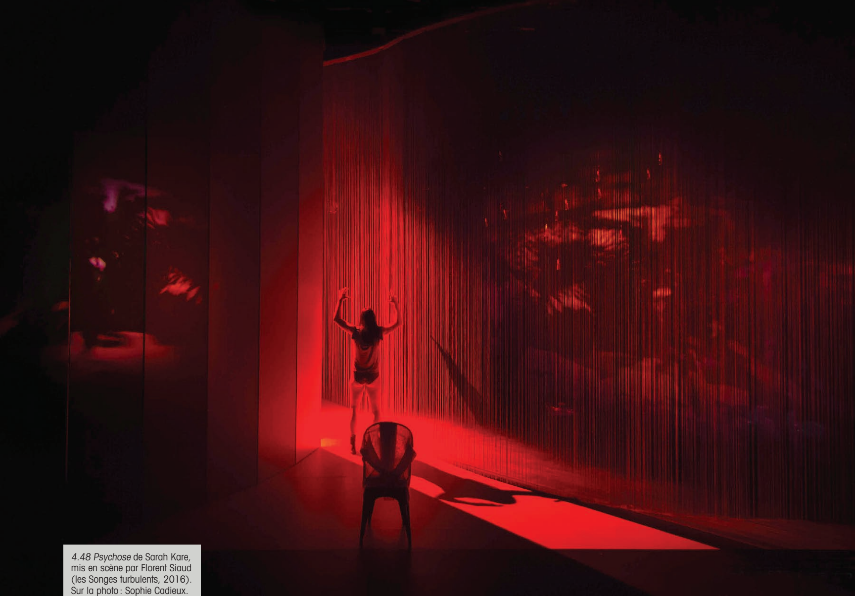
4.48 Psychose de Sarah Kare, mis en scène par Florent Siaud (les Songes turbulents, 2016). Sur la photo : Sophie Cadieux.

j'ai envie de reproduire dans un monde théâtral. Sur les immenses plateaux, on est confronté, particulièrement avec les chœurs, à des enjeux de placement. Comment investir l'espace, comment l'habiter, comment le rendre signifiant ? Comment placer les corps les uns par rapport aux autres, quel sens se dégage des diagonales, des cercles ? La poésie des images, la dimension plastique, ça me vient de l'opéra.»