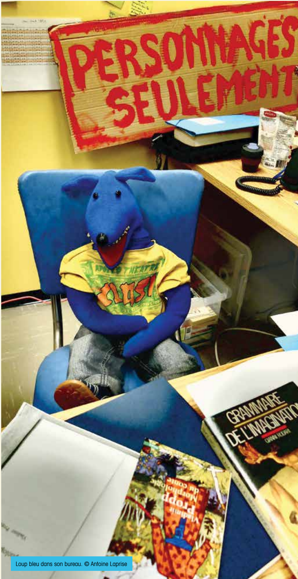
Loup bleu dans son bureau.