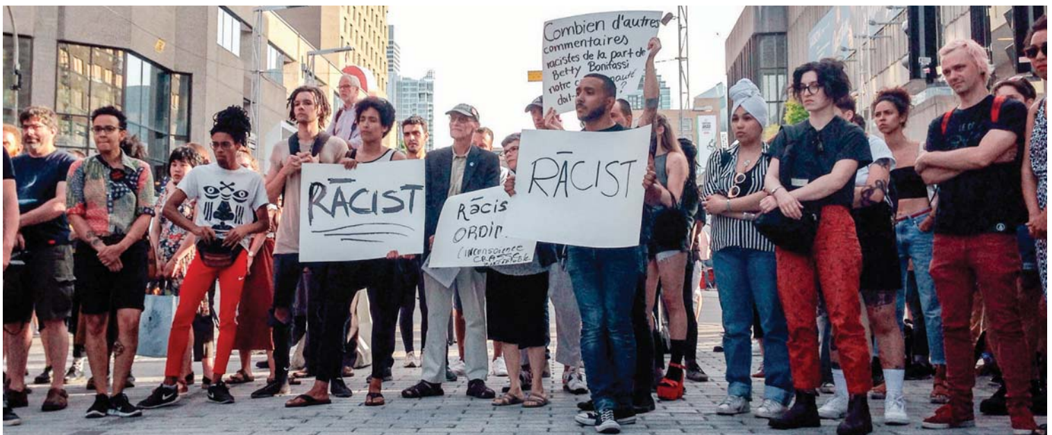
Manifestation devant le TNM contre le spectacle SLĀV de Betty Bonifassi et Robert Lepage le 26 juin 2018.

Cette librairie était aussi située à quelques jets de pierre du Théâtre du Nouveau Monde, là où, en juillet 2018, fut décrié avec vigueur le spectacle SLĀV de Robert Lepage. Des manifestants provenant principalement de la communauté noire montréalaise ont protesté contre la tenue de ce spectacle signé par des artistes blancs, mettant en scène des chants esclavagistes issus majoritairement du répertoire afro-américain et interprétés par une minorité d'artistes noirs. Cette manifestation où fut lancé, à l'arrivée des spectateurs et des spectatrices, le mot raciste , entre autres, a littéralement embrasé les tribunes en portant haut et fort sur la place publique les notions d'appropriation culturelle et de racisme systémique, et en dénonçant la sous-représentation sur nos scènes de pans entiers de notre société.