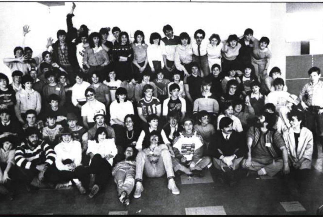
Les participants, étudiants et animateurs, au Temps des sourciers