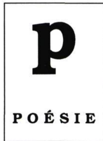
Gabrielle Poulin Petites Fugues pour une saison sèche