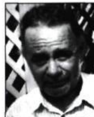
PATRICE DESBIENS La Fissure de la fiction Poème narratif