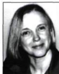
LOLA LEMIRE TOSTEVIN Kaki traduction par ROBERT DICKSON Roman