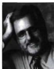
DONALD DESCHÊNES Les Voleurs de poules et autre contes à rire de l'Ontario français Contes choisis et adaptés