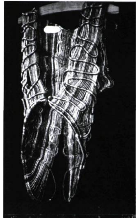
veste à queue