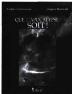
Andrée Christensen et Jacques Flamand, Que l'Apocalypse soit! , les Éditions David, Orléans, 2000, 140 p.