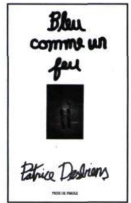
Patrice Desbiens, Bleu comme un feu , Prise de parole, Sudbury, 2001, 70 p.

Les auteurs transposent la figure sibylline dans une représentation de l'âme de la conscience humaine.