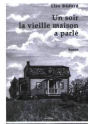
Lise Bédard, Un soir la vieille maison a parlé , Ottawa, Vermillon, 2002, 288 pages.

Un auteur écrit pour se faire lire, mais un auteur n'est pas nécessairement vendeur. Liaison a voulu le vérifier en osant poser à chacun des dix auteurs en lice une terrible question : «Pourquoi devrions-nous lire votre œuvre?» Ils ont habilement relevé le défi. Maintenant, à vous, lecteurs, d'en faire autant. Premièrement, laissez-vous séduire; deuxièmement, lisez; finalement, commentez un ou plusieurs des titres candidats. Vous pourriez ainsi gagner un abonnement annuel à la revue Liaison , plus un des livres en concours. Dix tirages de cette valeur seront effectués parmi tous les commentaires reçus avant le 4 avril. Pour vous informer, visitez le www.radio-canada/prixdeslecteurs ou composez le 1-800-461-1138. À vos lectures! Mais avant, parole aux auteurs!