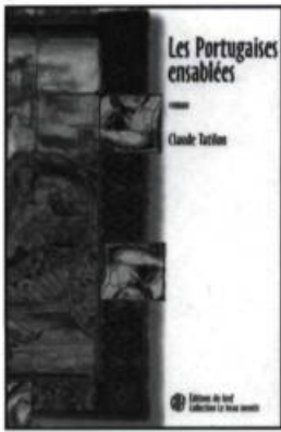
Claude Tatilon, Les Portugaises ensablées , Toronto, Éditions du GREF, collection «Le beau mentir», 2002, 155 pages.