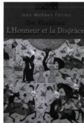
Jean Mohsen Fahmy, Ibn Khaldoun. L'honneur et la disgrâce , Ottawa, L'Interligne, 2002.

Où que vous soyez dans votre cheminement personnel, ce livre vous mènera quelques pas plus loin. Dans quel sens? Vous le verrez bien. Décider de se donner une progéniture quand on n'en a pas le pouvoir... ou encore le vouloir. Un dilemme bien de notre époque. Les géniteurs réels et potentiels de cette histoire se posent des questions qui nous chicotent tous. Toutefois, même si vous arriviez à la même réponse qu'eux, vous agiriez sans doute différemment... Enfin, à vous de voir. Vous voudrez sûrement connaître le sort de ces personnages, des gens qui parsèment notre quotidien. Or, après la lecture de ce livre, vous les verrez d'un autre œil. Mes géniteurs tentent de cogiter comme des êtres sensés et sérieux, mais je ne les laisse pas faire. Je vous convie donc à passer un agréable moment de réflexion romanesque sous le signe d'un humour légèrement décalé et tout à fait désaxant.