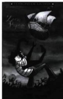
Francis Chalifour, Zoom Papaye , éditions de la Paix, 2002.

Puisque j'ai perdu mon père en bas âge, Zoom Papaye m'a véritablement renversée, et j'admets avoir pleuré comme une Madeleine en lisant plusieurs passages. Comme j'aurais aimé avoir la chance de lire Zoom Papaye quand j'étais petite! Parce que, en effet, le deuil c'est comme la picote. Et pour plusieurs jeunes, ça piquera toujours un peu! •