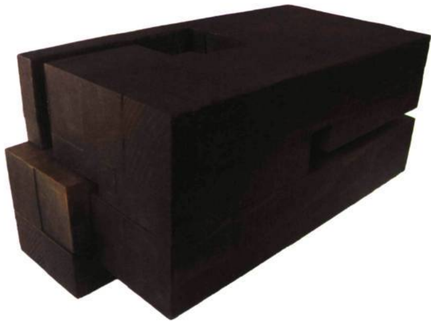
DEMEURE N° 8, 2002 Bois polychrome, 15 x 15 x 30 cm