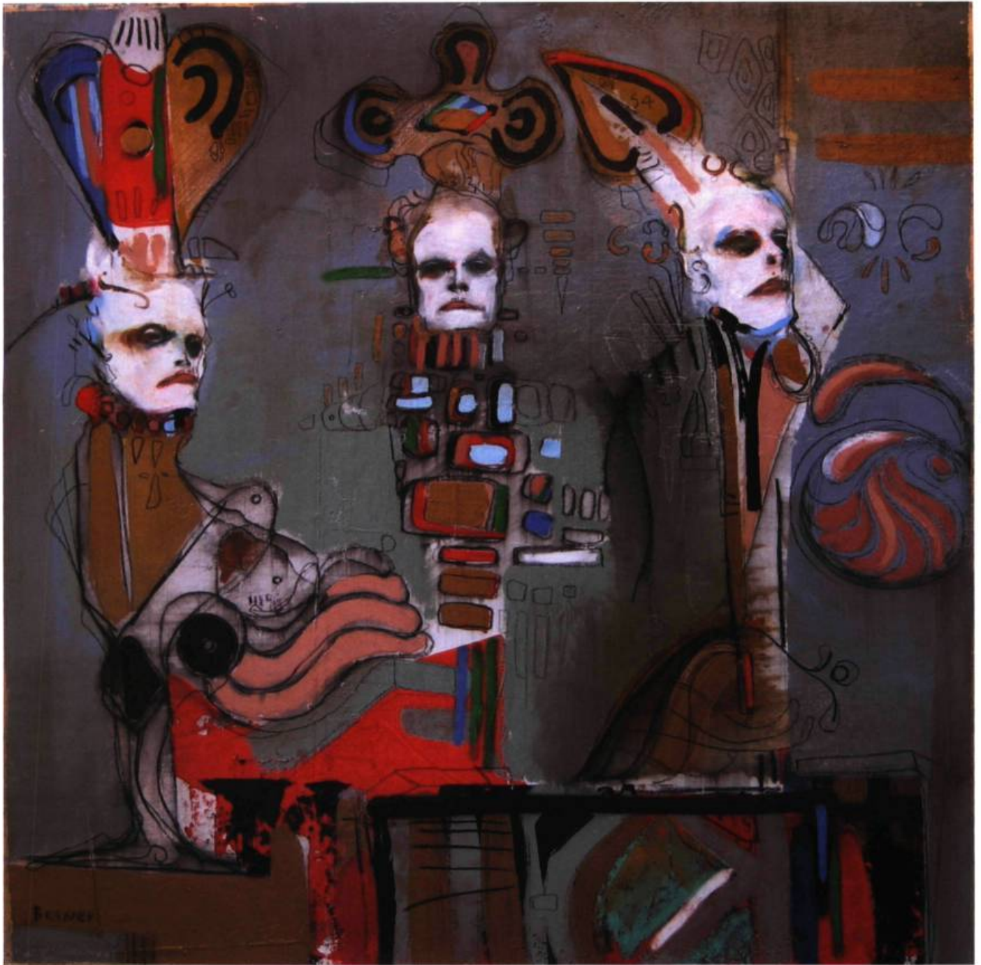
Les fritz du kasino (2005) Techniques mixtes sur toile, 30 X 30 pouces