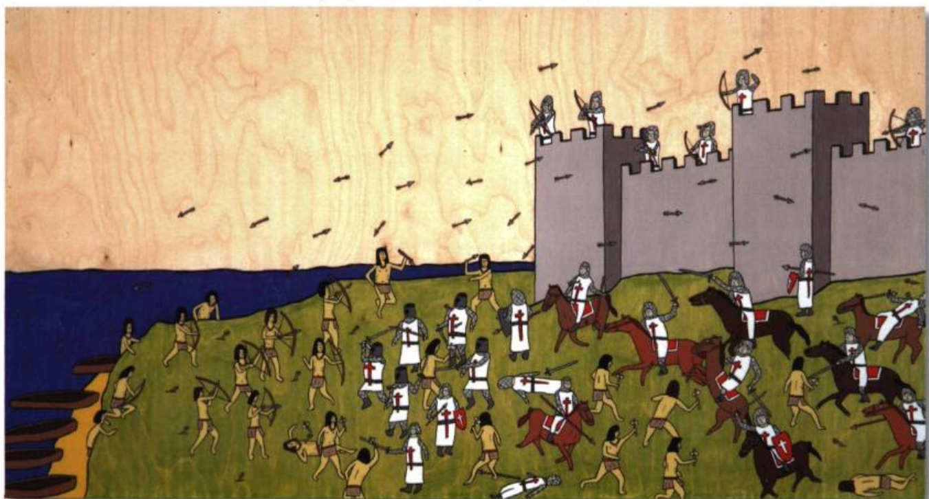
Mario DOUCETTE, La croisade des Amérindiens en Europe I , pastel, encre et acrylique sur bois, 66 cm x 122 cm, 2005.