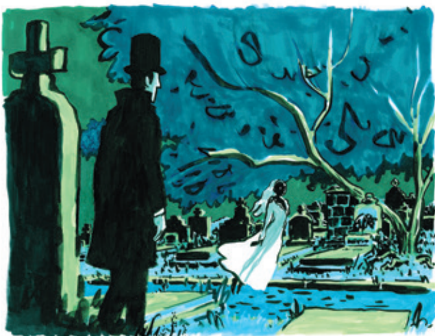
« Bon. Encore une qui a oublié d'ajouter un hashtag cocasse au bout de son ultime billet. »

Lorsqu'on regarde l'histoire des sociétés, il y a toujours eu des conduites populaires en marge de la religion instituée. La religion catholique nous a fait croire qu'elle seule avait un discours cohérent sur le sens, si bien que depuis qu'elle est moins déterminante, le rapport à la mort, en termes d'octroi d'une vie aux morts, à la pensée de la mort, s'est étiolé, nous laissant encore plus démunis... et fuyants. Les rites funéraires permettent de nous relier les uns aux autres et à toutes sortes d'imaginaires à la fois de la vie de l'individu – sa biographie –, mais aussi à l'imaginaire d'une société des morts. Ils nous font nous relier à la nature aussi parce que quand on est devant la naturalité d'un corps, on est devant la détérioration cyclique du vivant. Tout vivant est promis à la mort. Tout ça marche ensemble, la nature, les uns les autres, la communauté, les imaginaires, que ce soit des dieux, des principes spirituels, des ancêtres. Dans bien des sociétés, la mort est l'occasion de saluer les ancêtres. Tout ça a une fonction sociale organique. Le rapport à la nature, au cycle des saisons, les imaginaires esthétiques, formels, toutes les formes d'art fortifient les liens. Les humains ont besoin d'un rapport à une limite qui les dépasse et ce n'est pas anodin; autrement il n'y a qu'une matérialité brute, qui nous blesse. Rapidement dit: si plus rien ne nous dépasse, anthropologiquement, c'est un problème.