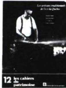
Les artisans traditionnels de l'est du Québec (no 12) 1979. 390 p., ill. 8$