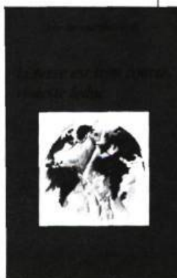
Jovette Marchessault La terre est trop courte, Violette Leduc 160 p., $8.95