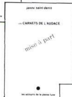
Mise à part 32 p., $3.50