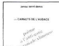
Poème à l'anti-gang 28 p., $3.50