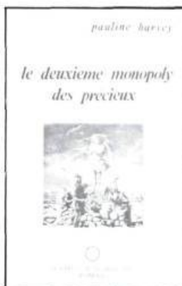
Pauline Harvey Le deuxième monopoly des précieux 224 p., $9.95