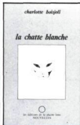
Charlotte Boisjoli La chatte blanche 112 p., $7.95