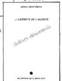
Dollars désormais 28 p., $3.50