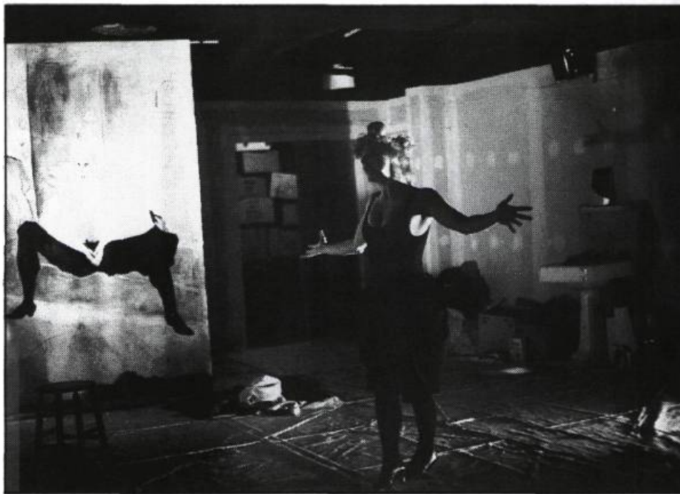
Pirandella (Espace Go)

En ce début de saison où les créations québécoises étaient rares et pauvres (que l'on pense au Déversoir des larmes ou au Chien qui fume ), Pirandella se présentait comme un objet théâtral à hauts risques, qui ne s'est pas véritablement «accompli» et pouvait provoquer l'ennui, mais dont la démarche demeurerait tout de même éminemment louable. Pour ma part, j'aime cent fois mieux ces essais que le ron-ron satisfait que l'on voit trop souvent sur nos scènes. J'aurai toujours beaucoup de tendresse et d'estime pour le théâtre qui se joue à ses risques et périls.