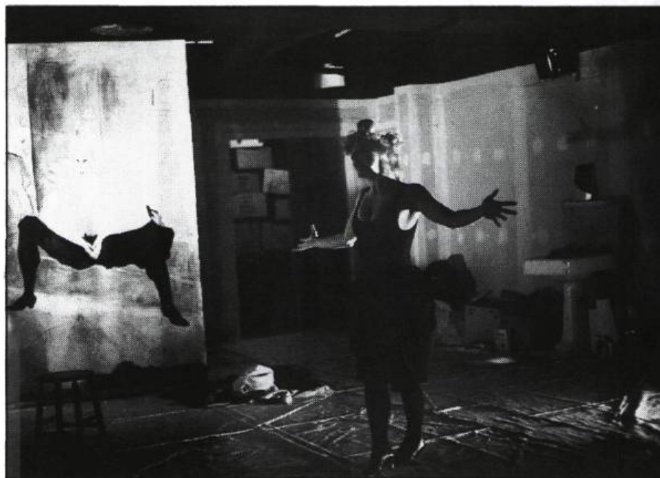
Pirandella (Espace Go)

En ce début de saison où les créations québécoises étaient rares et pauvres (que l'on pense au Déversoir des larmes ou au Chien qui fume ), Pirandella se présentait comme un objet théâtral à hauts risques, qui ne s'est pas véritablement «accompli» et pouvait provoquer l'ennui, mais dont la démarche demeurerait tout de même éminemment louable. Pour ma part, j'aime cent fois mieux ces essais que le ron-ron satisfait que l'on voit trop souvent sur nos scènes. J'aurai toujours beaucoup de tendresse et d'estime pour le théâtre qui se joue à ses risques et périls.