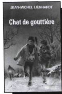
Chat de gouttière Jean-Michel Lienhardt 144 pages • 7,95$

Une équipe d'exploration débarque sur la planète Cristóbal-Colón. Parmi les savants se cache un incendiaire qu'Arialde Henke, dans une cinquième aventure, sera chargée de découvrir.