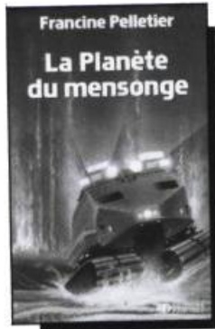
La Planète du mensonge Francine Pelletier 160 pages • 7,95$

La suite très attendue des romans La requête de Barrad et La prisonnière de Barrad du même auteur. Cette fois, ce sont les sylvaneaux et les sylvanelles que l'auteur nous invite à découvrir.