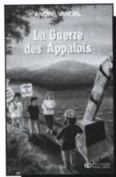
La guerre des Appalois André Vandal 160 pages • 7,95$

Ce roman d'aventure raconte la lutte menée par cinq jeunes adolescents afin de préserver intact un sommet des Appalaches qu'un constructeur sans scrupules veut développer.