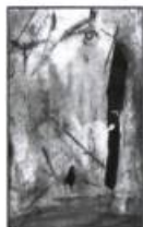
Michel Boutet Œuvres Francine Vernac 15,00 $