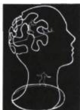
Geneviève De Celles Œuvres de l'auteure 15.00$