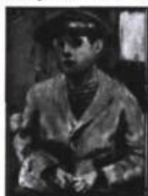
René Jacob Œuvres de Susan G. Scott 15.00$