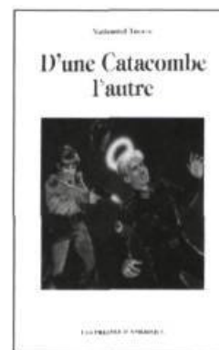
Nathaniel Thorne D'une Catacombe l'autre 175 p., 20 $