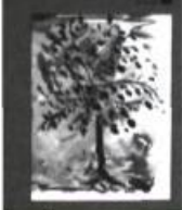
CLAUDE GAUVREAU ÉCRITS SUR L'ART Édition préparée par Gilles Lapointe