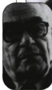
Jean Paul Lemieux