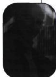
Paul Chamber- land

Des garçons gravissent un talus, l'un d'eux, torse nu, porte un serpent lové autour de son cou. Plus loin un autre, le front appuyé contre un tronc d'arbre, urine paisiblement.