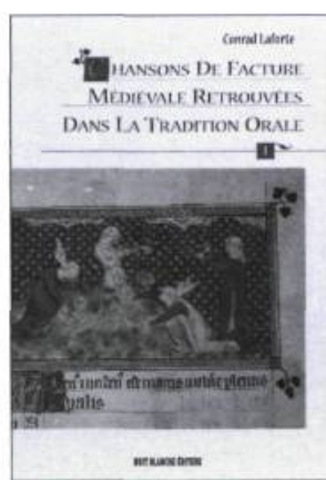
CHANSONS DE FACTURE MÉDIÉVALE RETROUVÉES DANS LA TRADITION ORALE Tomes I et II (sous coffret) Conrad Laforte 955 pages 75 $