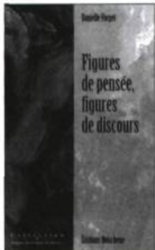
Danielle FORGET Figures de pensée, figures de discours 186 p. 23,95 $