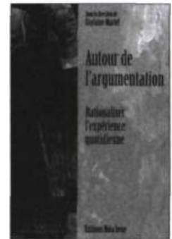
Sous la direction de Guylaine MARTEL Autour de l'argumentation. Rationaliser l'expérience quotidienne 184 p. 24,95 $