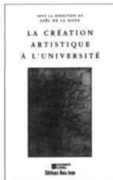
Sous la direction de Joël DE LA NOË La création artistique à l'Université 110 p. 19,95 $