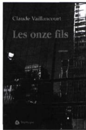
Claude Vaillancourt LES ONZE FILS roman, 615 p., 25 $

En se réveillant d'une brosse de vingt ans, Paul Dubé découvre un drôle de message sur son répondeur. S'enclenche alors une suite d'événements qui amènent à remonter le temps. Raconté avec une ironie mordante, ce roman évoque les années 70 sans verser dans le mythe de l'Âge d'or véhiculé par les fabricants de nostalgie. Une histoire galopante servie par une écriture qui ne mâche pas ses mots.