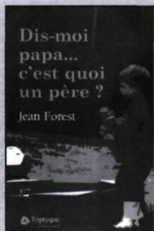
JEAN FOREST Dis-moi papa... c'est quoi un père? essai, 210 p., 18 $

Sur le modèle du Dictionnaire des pensées politiquement tordues , l'auteur et professeur a choisi de réunir sous différents thèmes des proverbes et citations célèbres détournés par l'esprit vif et cinglant de ses élèves. L'ouvrage s'ouvre sur une introduction qui propose une petite histoire du rire.