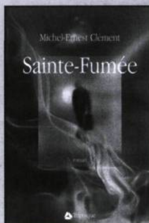
MICHEL-ERNEST CLÉMENT Sainte-Fumée roman, 370 p., 23 $

Il est urgent de s'interroger sur la fonction paternelle. Il ne s'agit pas de répondre à la critique du rôle politique et économique des pères en Occident, ce serait prendre l'effet pour la cause. Il faut plutôt comprendre pour-quoi on en veut tant aux pères.