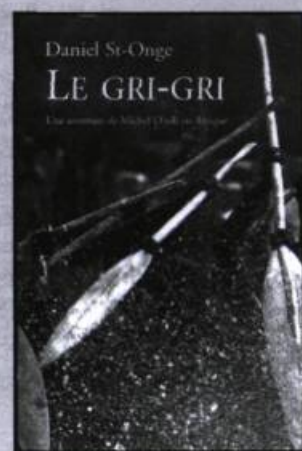
DANIEL ST-ONGE Le gri-gri roman, 197 p., 22 $

Alors que Phée Bonheur nous faisait découvrir l'univers d'une ancienne institutrice devenue boulangère par passion, Sainte-Fumée nous plonge dans les années cinquante, moment crucial de l'évolution des mentalités et des institutions au Québec, et reconstitue à merveille cet essor de la modernité d'après-guerre.