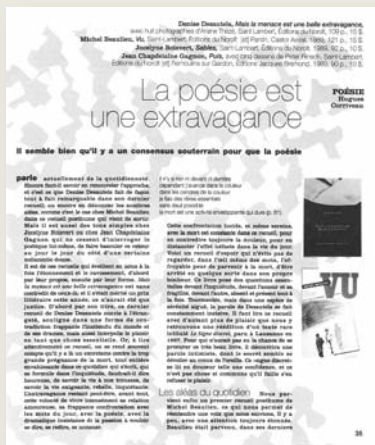
Une page olé ! olé ! du numéro 58. Pas facile à lire !