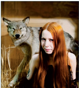
L'île aux naufrages (Marchand de feuilles). Chacun a obtenu une bourse de 500 $ offerte par SF Canada, l'association nationale des professionnels de la SF.