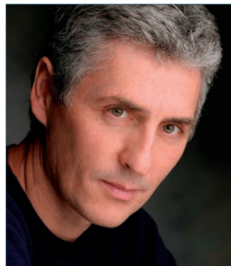
libraires du Québec, aux côtés du Quatrième mur (Grasset) de Sorj Chalandon (catégorie roman hors Québec).

L'orangerie (Alto), de Larry Tremblay , a remporté le Prix des