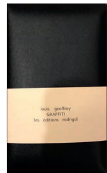
☆☆☆ Louis Geoffroy Graffiti Montréal, Rodrigol 2018, 46 f., 12 $

Au carrefour de l'écriture engagée et de l'écriture du corps, les poèmes de Graffiti proposent au lecteur un rôle actif dans l'expérimentation tactile et visuelle des textes, notamment sur le plan du rythme, mais l'invitent surtout à les partager, à les faire entrer en contact avec l'autre, résonance étonnante, pour peu qu'on y soit sensible, entre leur expérience intime et leur destination potentielle, orientée vers le monde extérieur. Aussi publics soient-ils, les graffiti ont tous une histoire intime. ♦