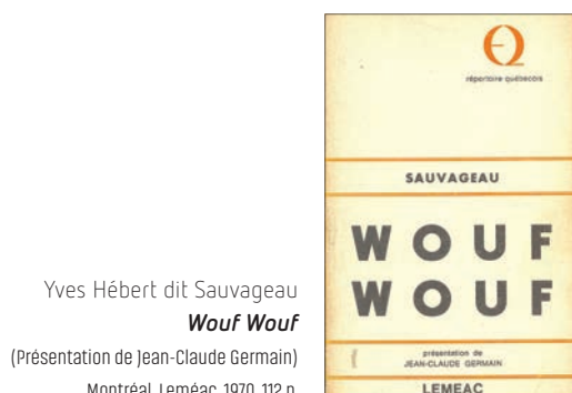
Yves Hébert dit Sauvageau Wouf Wouf (Présentation de Jean-Claude Germain) Montréal, Leméac, 1970, 112 p.