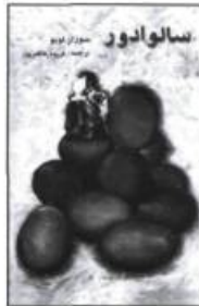
Édition iranienne de Salvador.