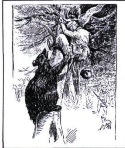
Illustration de Henri Julien pour le conte de Tom Caribou. Contes de Jos Violon de Louis Fréchette , L'Aurore 1974. Illustration reproduite avec l'aimable autorisation de l'éditeur.

livresque. Cet enfant devenu grand se résignera à ce qu'entre le livre et sa quotidieneté, la distance doive demeurer grande. Cela pourra soit l'ennuyer à la longue de ne jamais se sentir totalement concerné par ce qui y est dit (et il délaissera le livre), soit l'amener à fuir, dans la littérature, la vie réelle qui l'entoure. J'ai connu ainsi de ces collègues d'université dont toutes les racines littéraires étaient de France (c'était hélas dans le goût de cette époque morose que d'avoir un peu honte de nos racines...) Jamais un père ou une mère ne les avaient fait