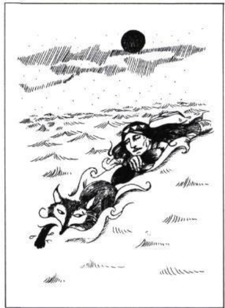
Les tours de Maître Lapin , de Marie-Andrée Warnant-Côté, Montréal 1976, les Editions Héritage, Collection Pour lire avec toi. Illustration de la page couverture en couleur et 11 illustrations intérieures en noir et blanc.