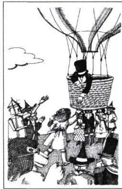
L'enchanteur du pays d'Oz , de Marie-Andrée Warnant-Côté, Montréal 1977, les Editions Héritage, Collection Pour lire avec toi. Illustrations de la page couverture en couleur et 10 illustrations intérieures en noir et blanc.