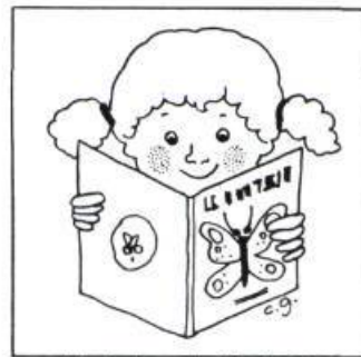
Illustrations de Cécile Gagnon

par la direction des services éducatifs, ces livres furent ensuite cotés, fichés et catalogués afin d'assurer leur mise en circulation au centre des ressources de l'école. Soit dit en passant, l'équipe du centre des ressources fait un excellent travail et le support désintéressé des bénévoles pour le primaire constitue un facteur vital de son bon fonctionnement.