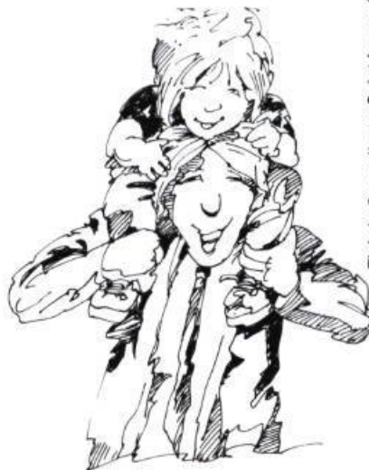
Tiré de Samedi, rue Saint-Laurent , illustration: Michel Fortier