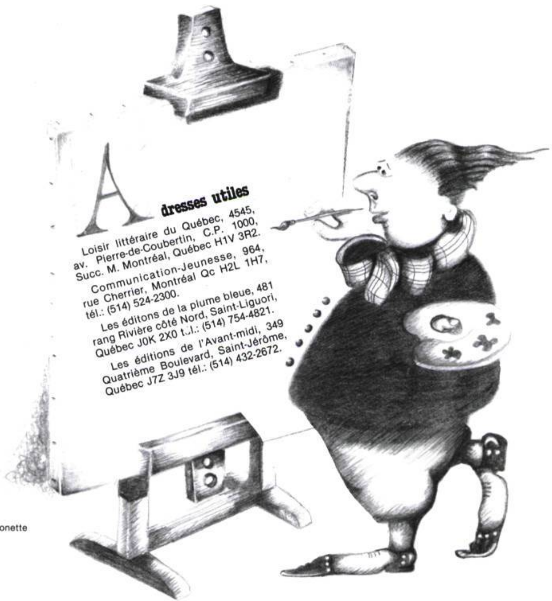
illustration : Lise Monette