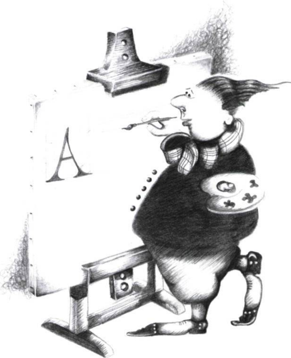
Illustration : Lise Monette

confiance en la compétence de l'animatrice et la bonne foi de chacun des participants. Avec cette disciple de Louky Bersianik j'ai vécu des moments d'anxiété fébriles et des impatiences face aux différents niveaux de langage des participants. Pour finalement y pondre des textes à partir de nouveaux trucs, c'est-à-dire, fiche signalétique surréaliste, colonnes de mes mots multipliées par d'autres mots contenant : qui les mêmes lettres, qui les mêmes sons qui les mêmes idées et images ; ça donne à partir d'un cantaloup : des cantates, un lapon anal, des loups, un andalou, un matou bananal, boules, chair froide et n'importe quoi de tropical... vous com-