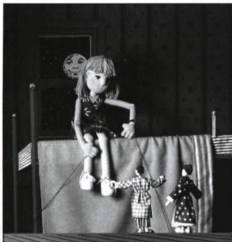
La Petite Fille qui avait mis ses parents dans ses poches d'Alain Fournier a été créé au cours de la saison 1992-1993. Ce projet artistique assez complexe pour ce qui est de la dramaturgie s'inspirait du bunraku .

L'UQAM offre quelques cours d'initiation mais elle n'a pas la prétention de former des marionnettistes. La formation s'acquiert donc essentiellement à l'intérieur des compagnies et dans des stages. Depuis quelques années, les marionnettistes choisissent d'aller étudier en Europe : la Tchécoslovaquie et l'Institut international de la marionnette de Charlesville-Lizière offrent notamment une formation universitaire de trois ou quatre ans. L'enjeu de la formation est double car un bon marionnettiste n'est pas nécessairement un bon comédien. Ayant rapidement compris cette difficulté, l'Avant-Pays a entrepris une recherche sur la voix composée : «Ce qui tue la marionnette, c'est la voix humaine. Une marionnette qui parle avec une voix de tous les jours, ça ne fonctionne pas. Mais pour composer les voix, ça prend de bons comédiens. Le rôle du metteur en scène, c'est de veiller à la distribution et de travailler l'interprétation.»