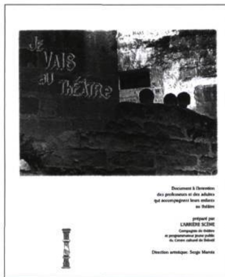
Je vais au théâtre , document préparatoire à l'intention des professeurs et des parents qui amènent des enfants au théâtre.