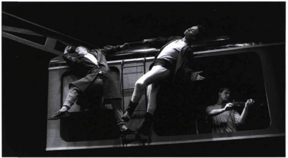
Train de nuit ou Le premier amour de Roy Rogers (1987) de Serge Marois, spectacle pour les jeunes et les adultes.