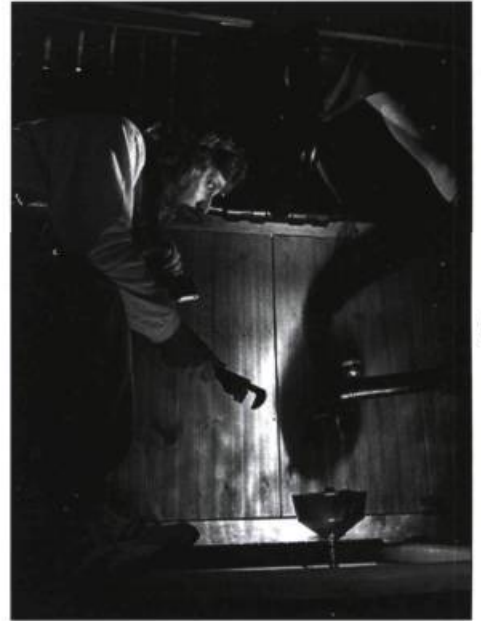
La ballade du plombier , de l' Illusion , Théâtre de marionnettes.

Les diffuseurs de ces régions ont pu, grâce à L'aventure T... , proposer aux écoles des programmations variées et complètes. Ainsi, les enfants de ces écoles auront été, très jeunes, sensibilisés aux arts et à la culture. Par exemple, à Terrebonne,