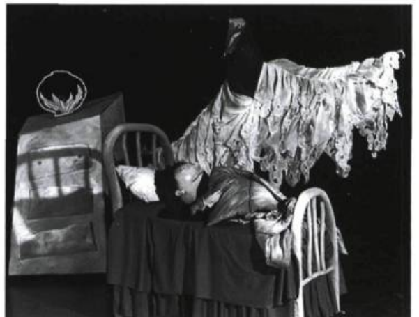
Jeux de rêves , du Théâtre Sans Fil, spectacle offert dans le cadre de L'aventure T...